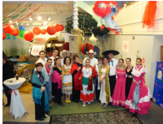
Amigos Latinoamericanos participando en el festival de carnaval con el tema de México presentado por el museo de niños Kidscommons en Febrero de 2009